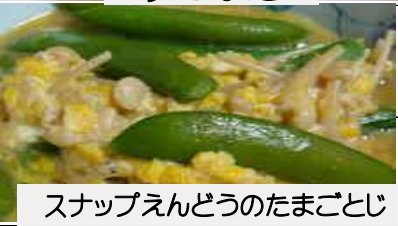
スナッピーえんどうのたまごとじ