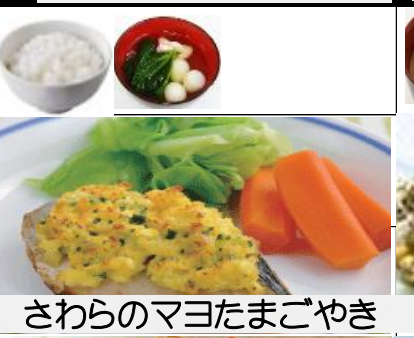
さわらのマヨたまごやき