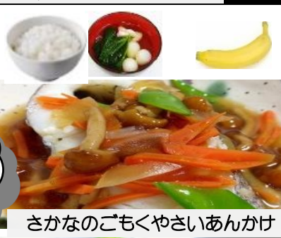
さかなのごもくやさいあんかけ