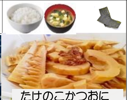
たけのこかつおに