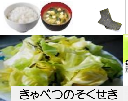
きゃべつのそくせき