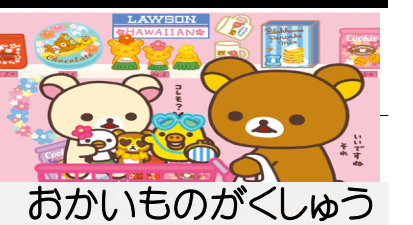
おかいものがくしゅう