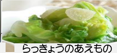
らっきょうのあえもの