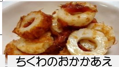
ちくわのおかかあえ