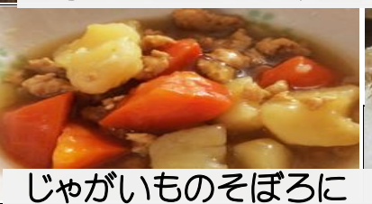
じゃがいものそぼろに