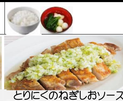
とりにくのねぎしおソース