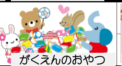
がくえんのおやつ