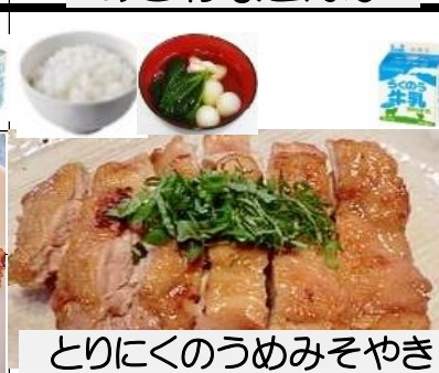
とりにくのうめみそやき