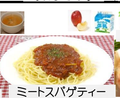
ミートスパゲティー