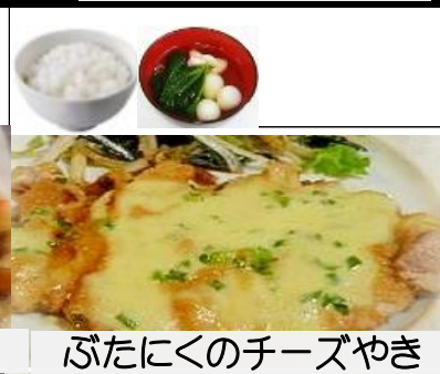
ぶたにくのチーズやき