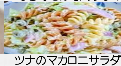
ツナのマカロニサラダ