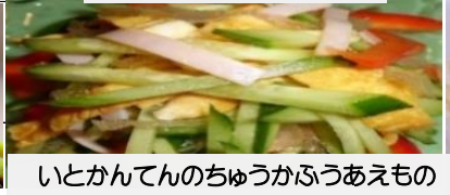
いとかんてんのちゅうかうふうあえもの