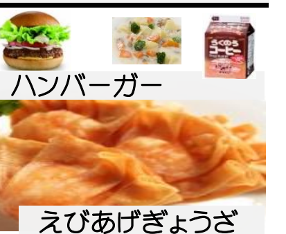
えびあげぎょうざ