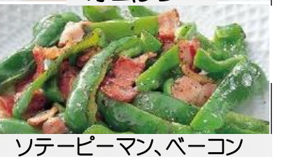
ソテーピーマン、ベーコン