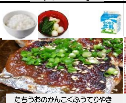
たちょうおのかんこくふうてりやき