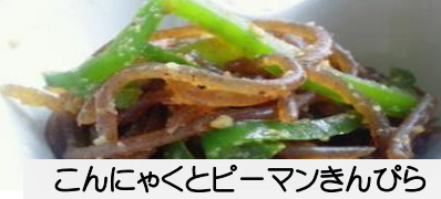
こんにゃくとピーマンきんぴら