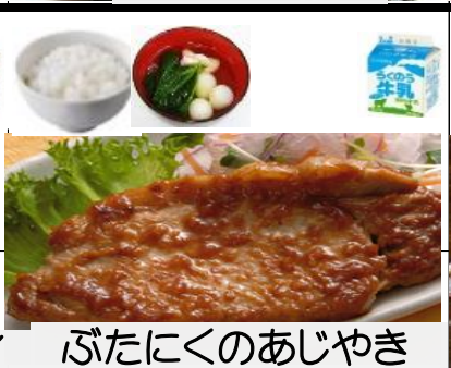
ぶたにくのあじやき